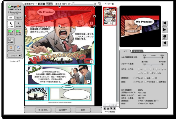
▲ Webマンガ編集ツール(コマ割エディター)

ることができます。また投稿したマンガの閲覧数などに応じて、広告収入が分配される仕組みになっています。なお、モバイルデバイスでもマンガを読みやすいようにファイルを変換・調整できる編集機能をご使用いただけます。シンプルなコマ割りのマンガであれば30秒で自動変換が完了します。