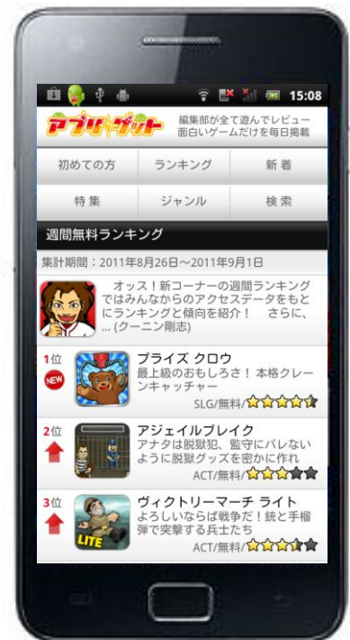
▲週間人気ランキング