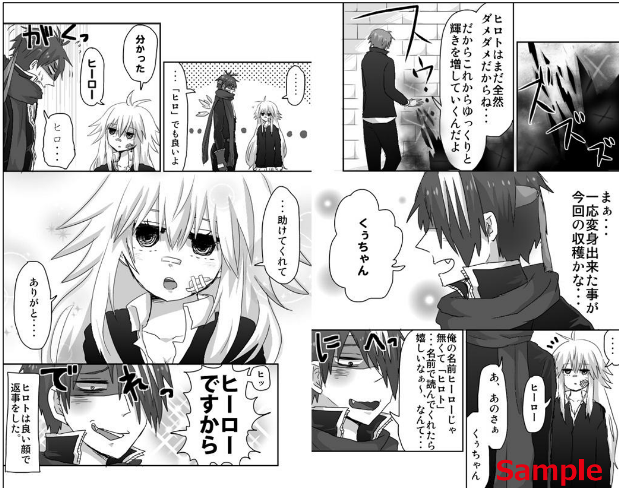
「BADHERO！」 (c) くーぱ