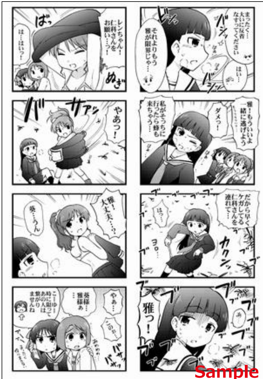
「ナン様とレン」 (c) なるあすく