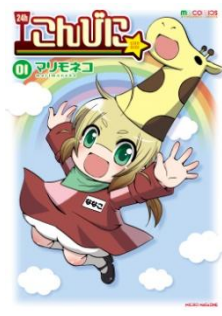
コンビニ