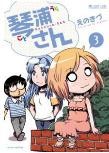
琴浦さん (c) えのきづ