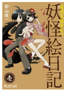
奇異太郎少年の妖怪絵日記 (c) 影山理一